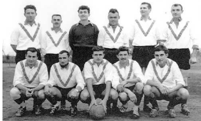
Union Sportive la Roche-Loudun

Après la guerre l'Union Sportive la Roche-Loudun évoluera en 1 ère division départementale, elle fut championne de première division en 1956 et accède à la Promotion d'Honneur et y restera 2 saisons. En 1959 elle dispute la finale de la Coupe du District contre Chauvigny et s'incline 2 buts à 1.