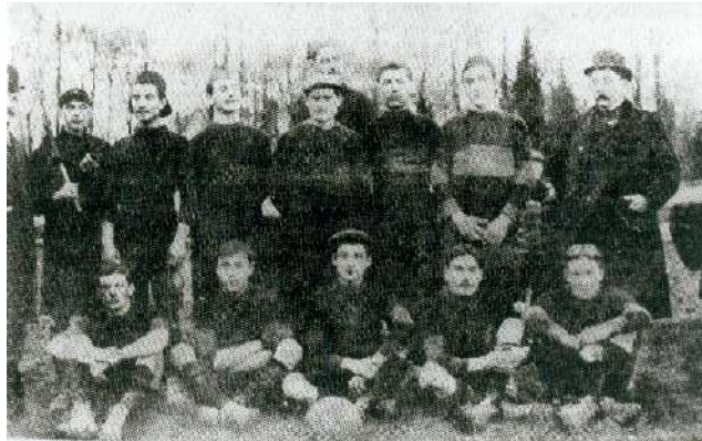
L'Union Sportive Loudunaise