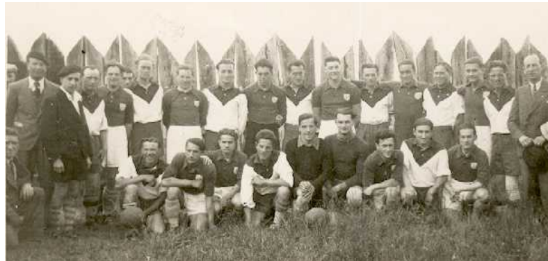
Union Sportive La Roche-Rigault-Loudun

sportifs, qu'ils soient de Loudun ou de la Vienne se rappellent avec une certaine nostalgie.