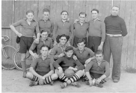
L'Union Sportive des Cheminots Loudunais